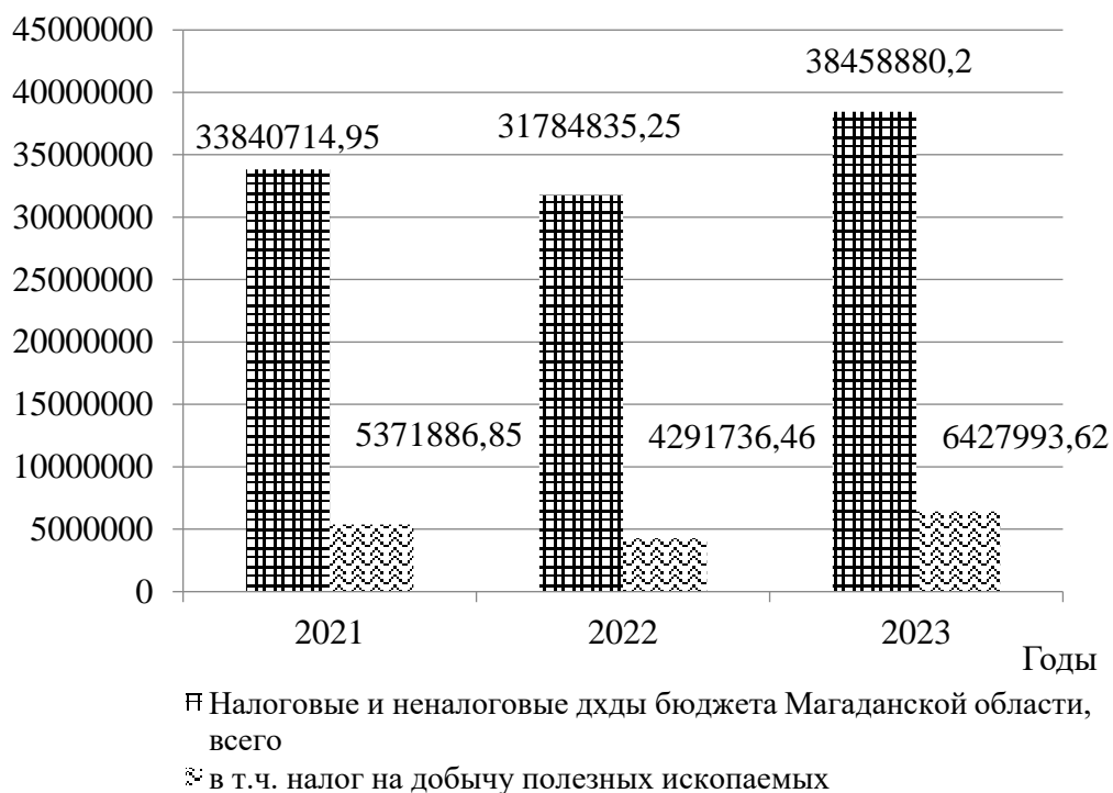
Рисунок 1. Динамика поступлений в бюджет Магаданской области налога на добычу полезных ископаемых за период с 2021-2023 годы, тыс. руб.

Наибольший удельный вес поступлений НДС в бюджете Магаданской области составляют налоговые поступления налога от добычу полезных ископаемых в виде драгоценных металлов (золота и серебра), которые добываются в Магаданской области из рудных и россыпных месторождений. Наиболее крупными налогоплательщиками являются такие ведущие предприятия горнодобывающей отрасли Магаданской области, как: АО «Полюс Магадан», АО «ЗРК «Павлик», ПАО «Сусуманзолото», АО «ГДК «Берелех», ООО «Конго», ООО «Омолонская ЗРК», АО «Серебро Магадана», ООО «Статус». Добыча драгоценных металлов в 2023 году велась во всех муниципальных округах Магаданской области [3].