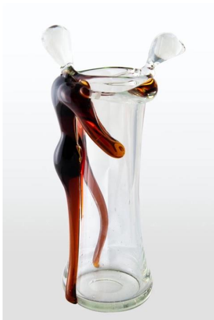
Рис.1 Смирнов Б. А. Ваза «танцующая пара» (1957)

Гордость коллекции - ваза «Танцующая пара» 1959 года наполнена юмором народных сказок и вызывает восхищение своей красочностью и нарядностью.