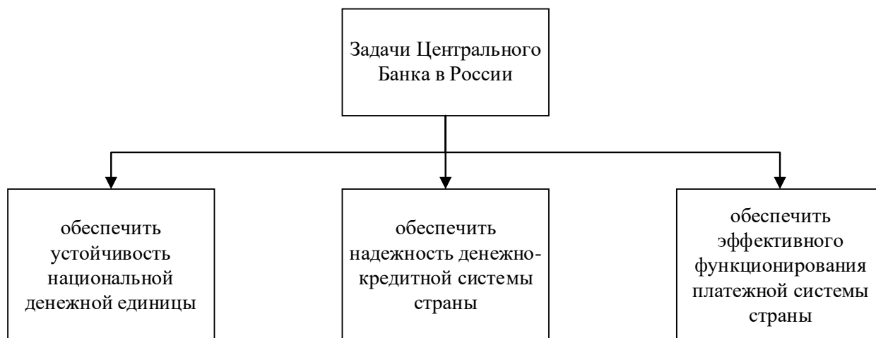
Рис. 1. Ключевые задачи Банка России [1]

порождает особенность функционирования Банка России как социально значимого института, полностью удовлетворяющего экономические и социальные общественные потребности. Перечислим ключевые задачи Центрального банка на рисунке 1.