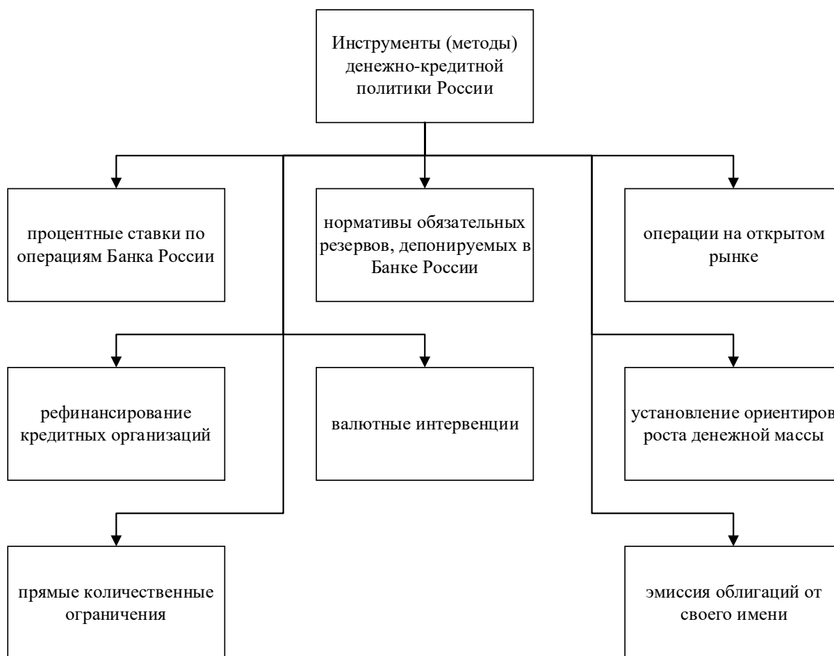
Рис. 4. Инструменты денежно-кредитной политики в РФ [3]

интересам общества и экономического развития, отвечать на вызовы и предотвращать угрозы, которые стремятся дестабилизировать существующий экономический и социальный порядок в стране [2]. Банк России в своем арсенале имеет 8 основных инструментов проведения денежно-кредитной политики и в соответствии с фактором независимости применять их на благо общества и экономики вне зависимости от текущей политической ситуации (рисунок 4).