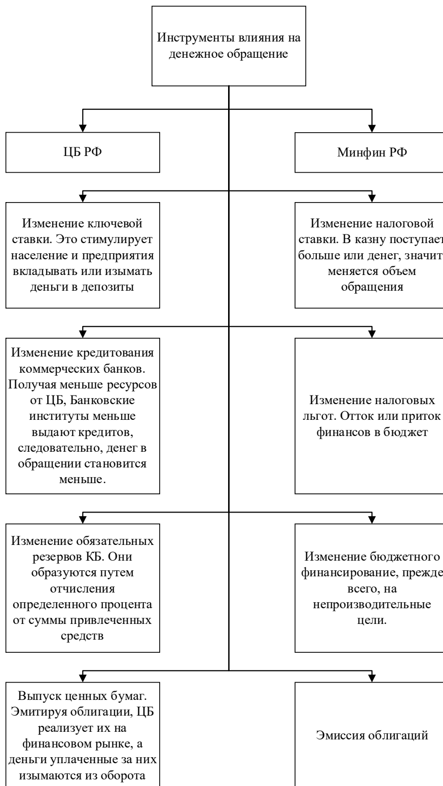
Рис. 5. Комплекс мер по регулированию денежной массы и кредитного обращения [6]

В настоящее время многие проблемы денежно-кредитной среды российской экономики остаются нерешенными, состояние денежного обращения и регулирования не является оптимальным. В частности, инфляция,