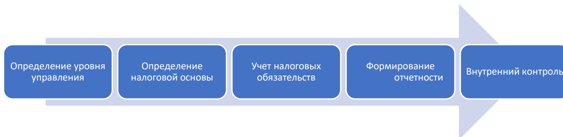
Рисунок 2. Процесс налогового учета

Порядок ведения раздельного налогового учета включает в себя следующие этапы, представленные на рисунке 2.