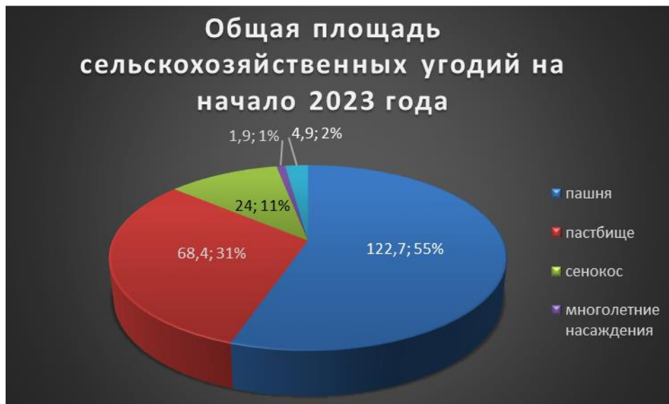
Рисунок 2 – Структура сельскохозяйственных угодий Российской Федерации на начало 2023 года

Структура сельскохозяйственных угодий на начало 2023 года выглядит следующим образом. (рис.2)