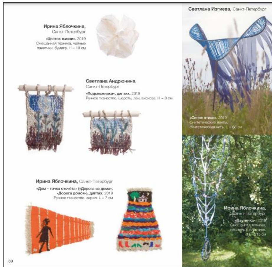
Рис. 2. Примеры творческих работ участников творческого лагеря