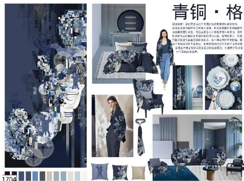
Рис.3. Работа участника конкурса «Красный, зелёный, синий кубок», отмеченная наградой [9].