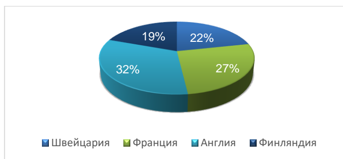
Рисунок 3 – Затраты на услуги салонов красоты в Европе

Например, большинство финских девушек предпочитают минимальные процедуры для кожи: главное, чтоб выглядела свежей и здоровой, а девушки в Швейцарии предпочитают тратить за предоставляемые услуги около 230 долларов в год, в Англии 198 долларов в год. Этот пример нам демонстрирует разницу, кто и как в большинстве своем ухаживает за собой. Результаты затрат на косметические услуги разных стран Европы приведены на рисунке 3.