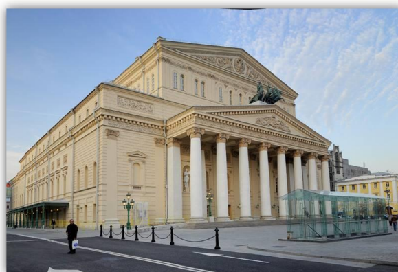
Рис.1,2 Сравнение старого и современного здания Большого театра

В дальнейшем театр претерпел несколько реконструкций и реставраций, однако концепт, созданный Бове до сих пор остался в основе этого здания.