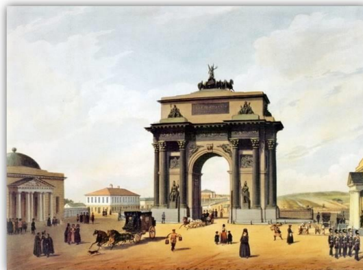
Рис.5,6 Сравнение старой и современной версии Триумфальной арки

Осип Иванович Бове не смог увидеть финального результата, так как скончался за 3 месяца до открытия памятника, состоявшегося 20 сентября 1834. Во времена советской перестройки Триумфальную арку разобрали для переноса, однако управление медлило с началом работ, и к началу Великой Отечественной Войны памятник лежал в разобранном виде. Восстановление было произведено лишь спустя 30 лет по зарисовкам архитектора 1936 г [11].