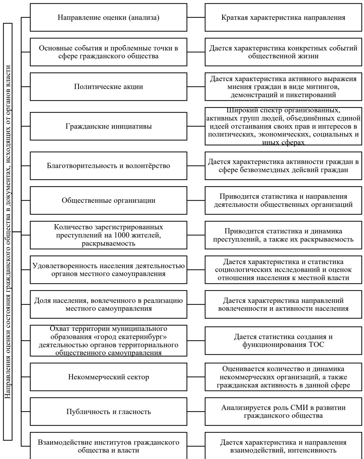
Рисунок 1 – Направления оценки состояния гражданского общества в документах, исходящих от органов власти [1], [2], [3]

Оценивая региональный опыт анализа состояния гражданского общества, можно выделить дополнительно ряд показателей, по которым проводится анализ, в частности в Самарской области оценивается, в том числе,