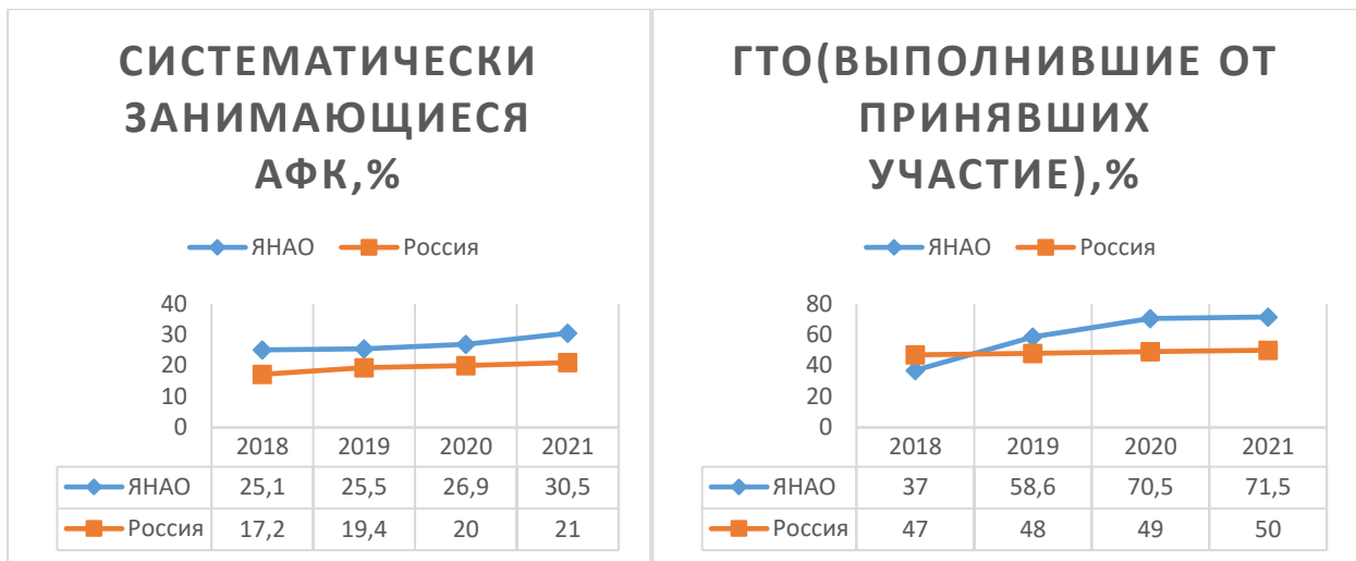
Рисунок 2 – ключевые показатели физической культуры и спорта ЯНАО

Развитие сферы физической культуры и спорта в ЯНАО связано с созданием современной инфраструктуры, повышением открытости и доступности информации для граждан, желающих систематически заниматься физической культурой и спортом, созданием равных возможностей для таких занятий с учетом индивидуальных потребностей.