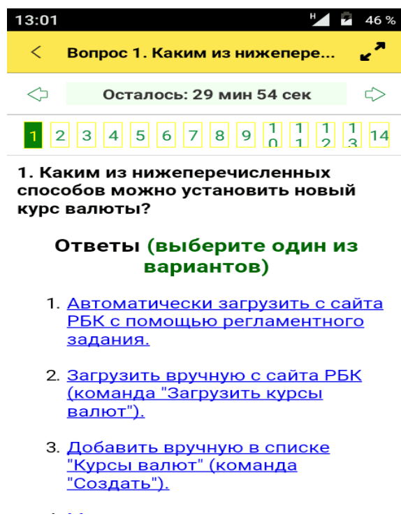
Рис.2 – Перечень вопросов в рабочем окне тренажера для тестирования «1С: Профессионал» в мобильном приложении С:Ник"

К преимуществам тренажера для тестирования «1С: Профессионал» можно отнести: