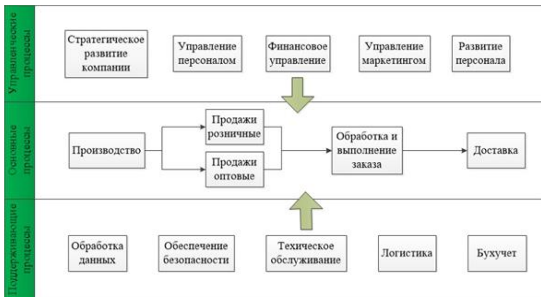
Рисунок 2. Сеть бизнес-процессов предприятия

Состав бизнес-процессов компании представлен на рисунке 2.