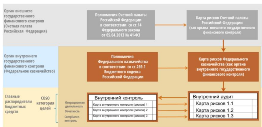
Рис.3 Схема взаимодействия Счетной Палаты РФ и Федерального Казначейства по вопросам формирования Карт рисков 1

Следует отметить, что между внутренним и внешним контролем наблюдается последовательная связь, которая обуславливает тесное информационное взаимодействие по таким аспектам, как: соотнесение Планов контрольных мероприятий, обмен информации о результатах проведенных проверок и выявленных нарушениях, совместная разработка Карты рисков и рекомендаций по их устранению. В целях повышения качества информационного обмена и подключения Счетной Палаты к системе, оператором которой является Казначейство было подписано Соглашение об информационном взаимодействии СП РФ и ФК РФ, которое определяет принципы, порядок подключения и перечень информации для совместного доступа (рисунок 3).