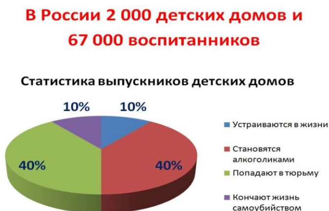
Рисунок 1 – Статистика выпускников детских домов в России.

Что касается детских домов, то выпускники детских домов не социализированы – не приспособлены к жизни. Они не знают, к чему стремиться, не умеют организовать свой быт, не имеют опыта семейной жизни, не умеют распоряжаться деньгами. Кому посчастливилось получить жилье, часто теряют его в ближайшие годы. Согласно статистике, мы имеем следующую ужасающую картину: из 67 000 воспитанников детских домов только 10% устраиваются в жизни, 40% попадают в тюрьму, другие 40 – становятся алкоголиками и оставшиеся 10% кончают жизнь самоубийством Рисунок 1.