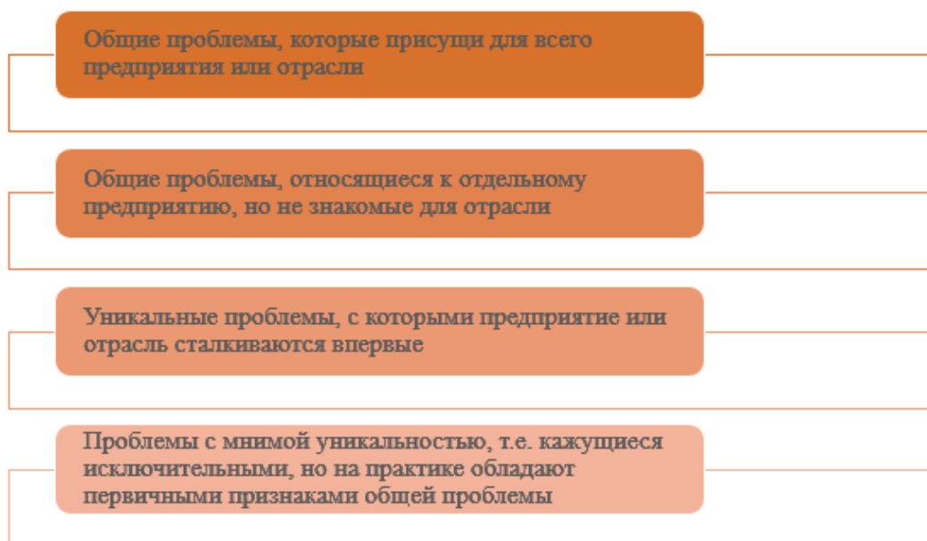
Рис. 2. Виды возможных проблем менеджера

Несомненно, в системе управления существует ряд многочисленных проблем, требующих их классификации. На рис. 2 представлены основные виды проблем эффективного управления современными организациями, с которыми могут столкнуться менеджеры в своей деятельности.