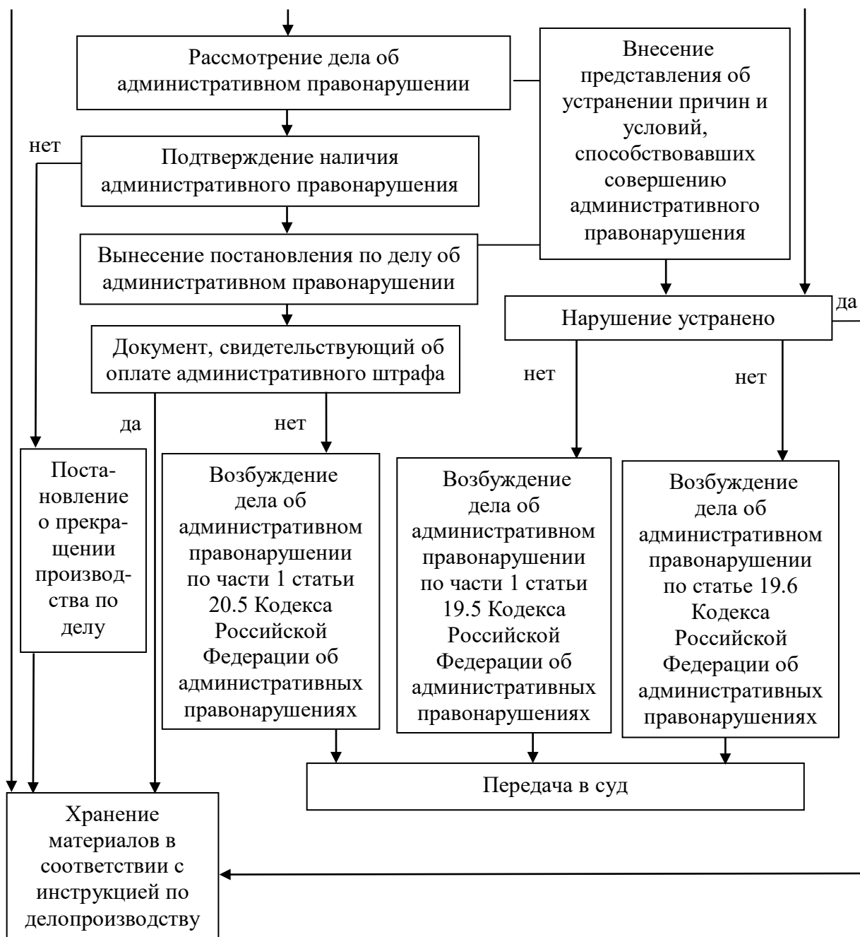
Рисунок 1. Процесс осуществления государственного земельного надзора при проведении проверок

Другим процессом осуществления государственного земельного надзора в рамках систематического наблюдения за исполнением требований законодательства Российской Федерации без проведения проверок является административное обследование объектов земельных отношений, которое проводится должностными лицами, уполномоченными на осуществление государственного земельного надзора.