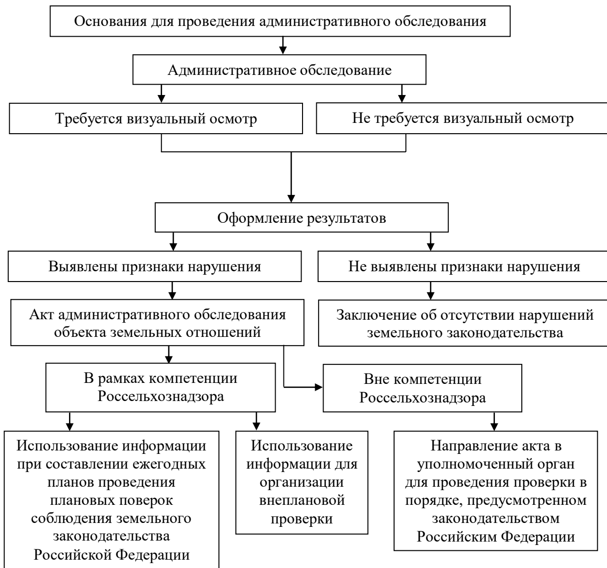
Рисунок 2. Проведение административного обследования объектов земельных отношений

юридическими лицами, индивидуальными предпринимателями, органами государственной власти, органами местного самоуправления, гражданами.