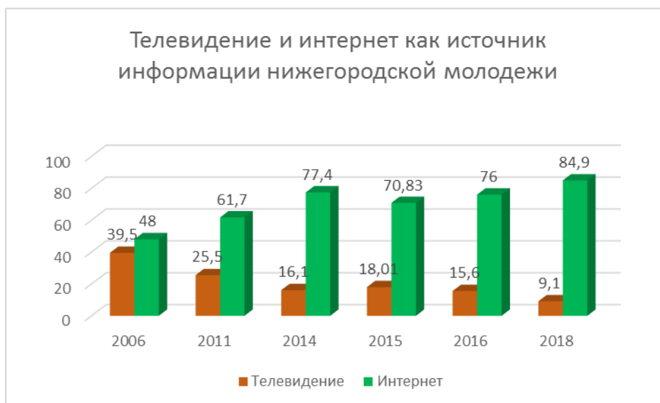
Рис.1 Доля молодежи, выбирающая телевидение и интернет в качестве основного информационного источника

На Рис. 1. приведены основные виды источников информации – интернет и телевидение. Отметим, что речь идет о том, что молодежь